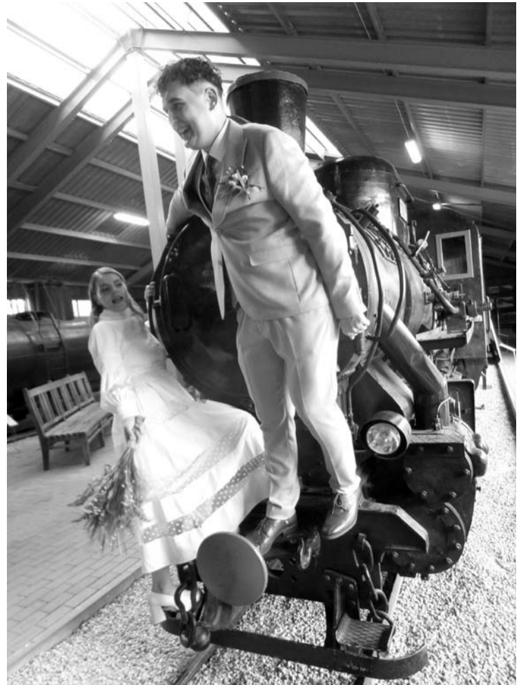
Neįprasta sutuoktvių vieta – Siaurojo geležinkelio istorinė ekspozicija Anykščiuose.