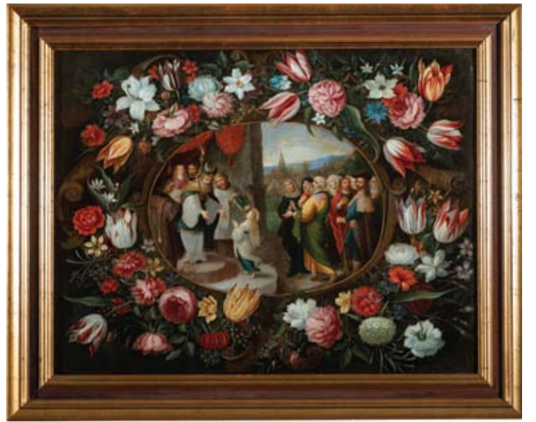
Šiuo metu XVII amžiaus kompozicijos „Marijos įvesdinimas į šventyklą“ Anykščiuose pamatyti nepavyks – darbas eksponuojamas Lietuvos nacionalinio dailės muziejaus Vilniaus paveikslų galerijoje veikiančioje parodoje „Florentem“.

„Paveikslą vertė tikrai nenukrito, kadangi tokie paveiksai, vaizduojantys Švč. Mergelės Marijos gyvenimą, atsirado tik XVII a. pradžioje. Ir prie šio žanro formavimo ištakų, kartu su kitais dailininkais, buvo F.