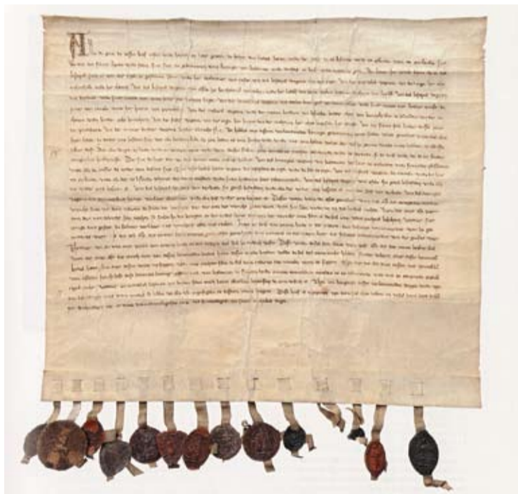
Lietuvos didžiojo kunigaikščio Gedimino 1323 metų spalio 2 dienos Taikos ir prekybos sutarties su Livonijos ordinu nuotrauka.

Pirmadienį, spalio 2 dieną, 17 valandą, Anykščių menų centro padalinyje – Anykščių koplyčioje, Pasaulio anykštėnų kūrybos centre (Vilniaus g. 36) – bus pristatytas iš Latvijos valstybės istorijos archyvo Rygoje į Anykščius atvežtas pats svarbiausias Aukštaitijos paminėjimo jubiliejaus ženklas, t. y. 1323 spalio 2 dieną Vilniaus pilyje pasirašytos Taikos ir prekybos sutarties originalas su antspaudais. Šioje sutartyje pirmą kartą paminėta Aukštaitija.