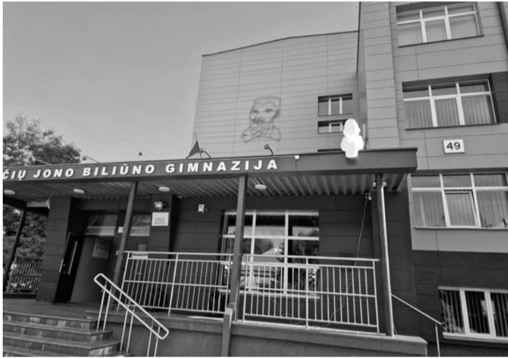
Anykščių Jono Biliūno gimnazijos pedagogai dalyvauja streike reikalaudami padidinti atlyginimus, sumažinti mokinių skaičių klasėse ir mokytojų darbo krūvį.

Įspėjamajame streike, kuris vyko rugsėjo 15 dieną, taip pat dalyvavo tik šios gimnazijos mokytojai – jų tuomet buvo kur kas daugiau.